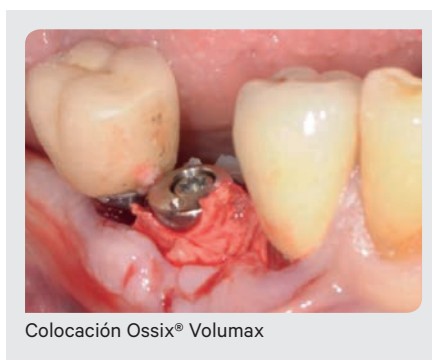
Colocación Ossix® Volumax