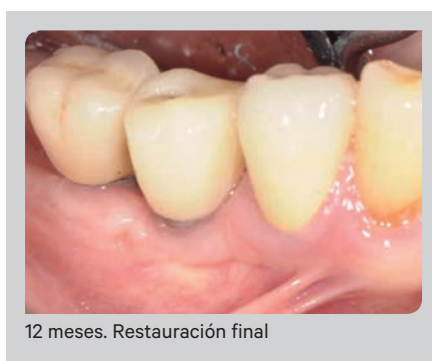
12 meses. Restauración final