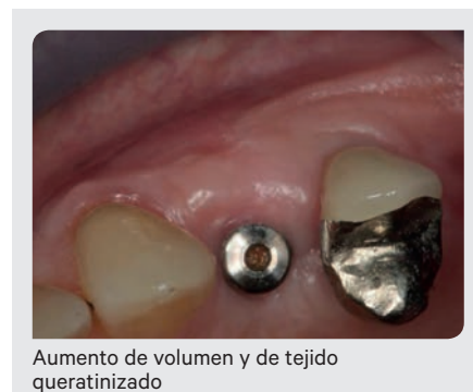
Aumento de volumen y de tejido queratinizado