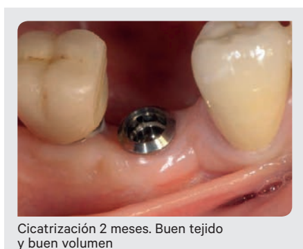
Cicatrización 2 meses. Buen tejido y buen volumen