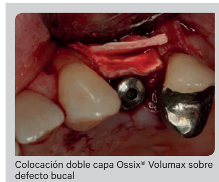
Colocación doble capa Ossix® Volumax sobre defecto bucal