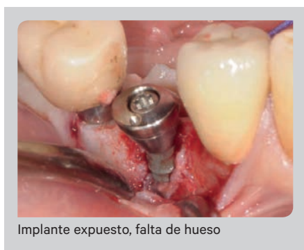
Implante expuesto, falta de hueso