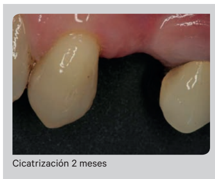
Cicatrización 2 meses