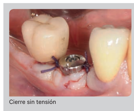
Cierre sin tensión